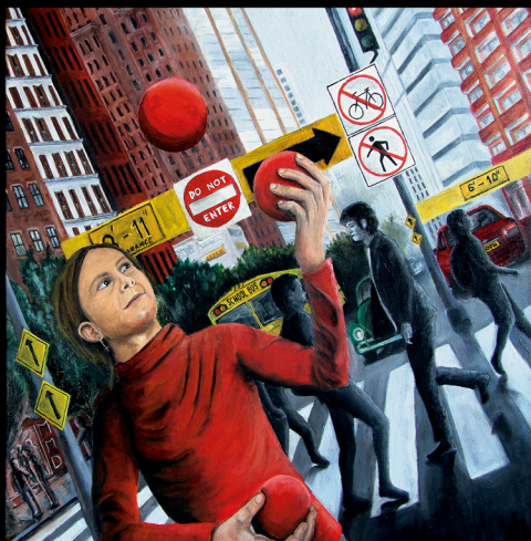
Portada de The Outsider (2023)

Son varios los proyectos y eventos en los que Numen está inmerso en este año 2023. A destacar la participación en el ProgRockFest de Legionowo (Polonia) el 9 de septiembre como cabeza de cartel y la publicación del cuarto álbum, The Outsider , con la participación de figuras destacadas como Steve Rothery ( Marillion ) o Dani García ( El Diluvi ).