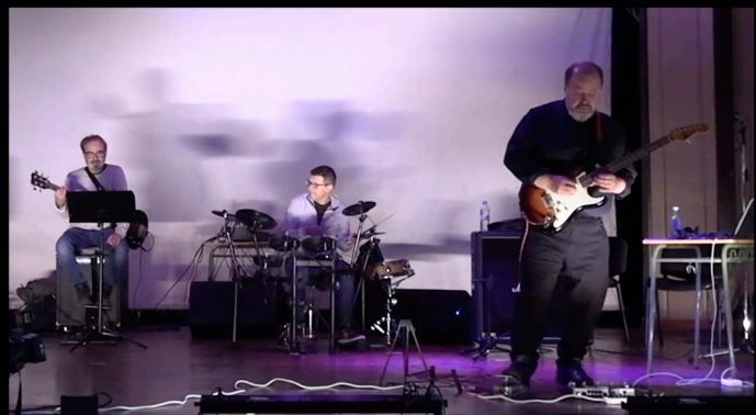
Numen and Steve Rothery ( Marillion )