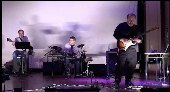
Numen and Steve Rothery ( Marillion )