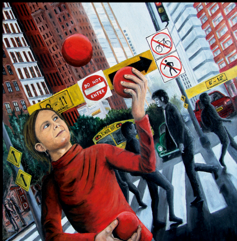
Cover of The Outsider (2023)