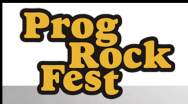
Participation as an support band at the Marillion Weekend Portugal 2022.